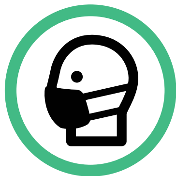
Obbligo di mascherina