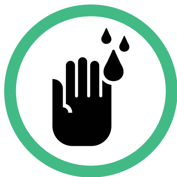
Lavarsi e igienizzare frequentemente le mani