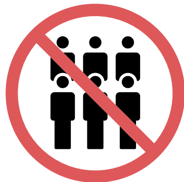
Divieto di assembramenti