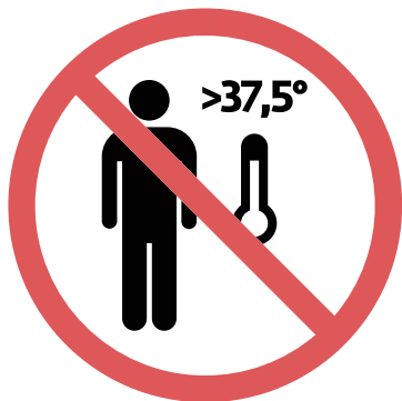
Accesso vietato in caso di febbre > 37,5° Le Gallerie degli Uffizi si riservano di misurare la temperatura

All'interno dei musei varranno tutte le norme nazionali e regionali per contrastare la diffusione del coronavirus. In particolare si rammenta che è vietato l'ingresso a persone con temperatura corporea oltre 37,5 gradi: sarà misurata la temperatura corporea con idonei strumenti prima dell'accesso; è obbligatorio l'uso di idonee mascherine CE (vedi Ordinanza RT n. 48) a copertura della bocca e del naso, durante tutta la permanenza all'interno dei musei; è necessario mantenere una distanza interpersonale raccomandata di 1,80 m; sono vietati assembramenti di ogni genere; i gruppi non possono eccedere il numero di 10 persone, e ad ogni buon conto sono tenuti a rispettare sempre la distanza interpersonale di 1,80m; le guide turistiche devono automunirsi di sistema whisper (microfono e auricolari), indipendentemente dal numero dei componenti del loro gruppo. Vista l'emergenza in atto con possibilità di contagio, si precisa che all'interno dei musei potrà accedere un numero massimo di persone che consenta il distanziamento minimo di un metro l'una dall'altra (consigliato un metro e ottanta). Il personale addetto al controllo delle sale espositive, una volta arrivato al massimo numero di persone consentito, impedirà l'accesso ad altre persone, e farà entrare le persone in attesa, distanziate l'una dall'altra anch'esse di almeno un metro. Per maggiori info visita il sito www.uffizi.it